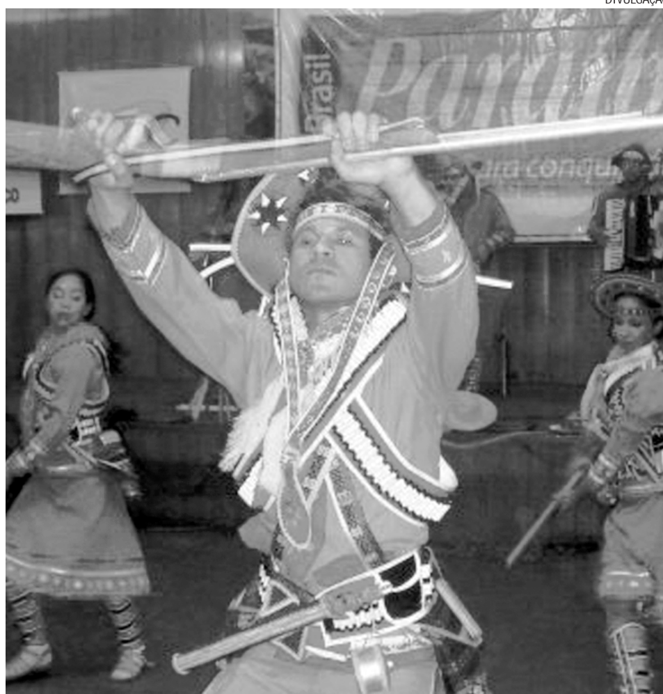
Ontem, o grupo folclórico do Sesc fez uma apresentação em Cuiabá, no Mato Grosso

Ano passado o grupo do Sesc-PB fez turnê por sete Estados do país: Alagoas,