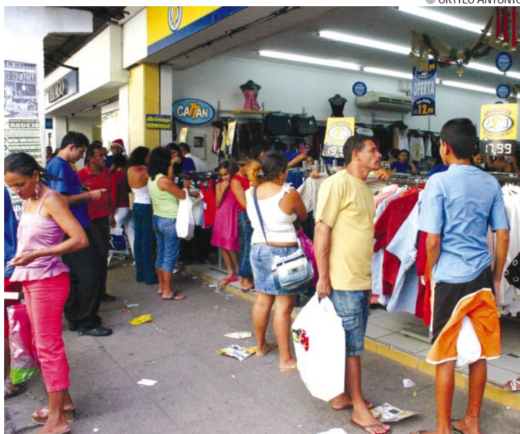
Confecções e calçados são as mercadorias mais procuradas no comércio