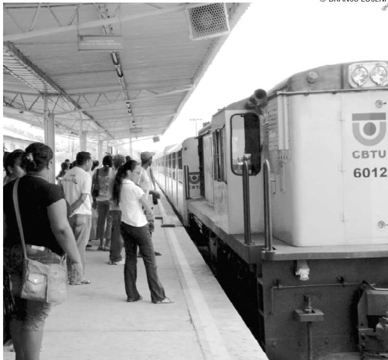
Capital terá revolução no transporte ferroviário com implantação do VLT

Esses projetos de modernização do transporte ferroviário urbano revelam a nova diretriz tomada pela Companhia a partir de meados deste ano, quando o governo federal decidiu investir nos sistemas existentes como forma de melhorar a acessibilidade da população e redesenhar o transporte público em cidades de médio porte. Dentro dessa nova linha