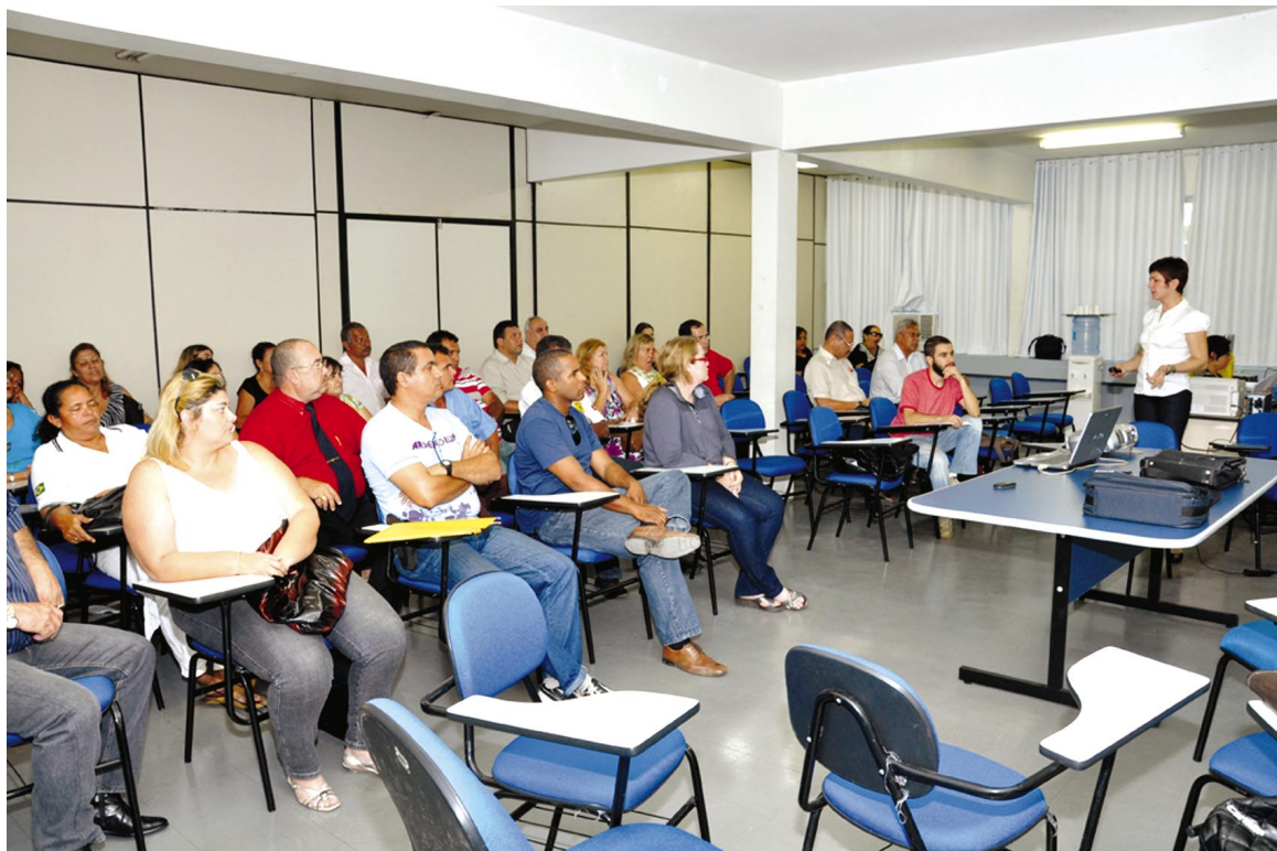
Representantes de secretarias e diretores de presídios se reúnem para definir estratégias de prevenção contra gripe A