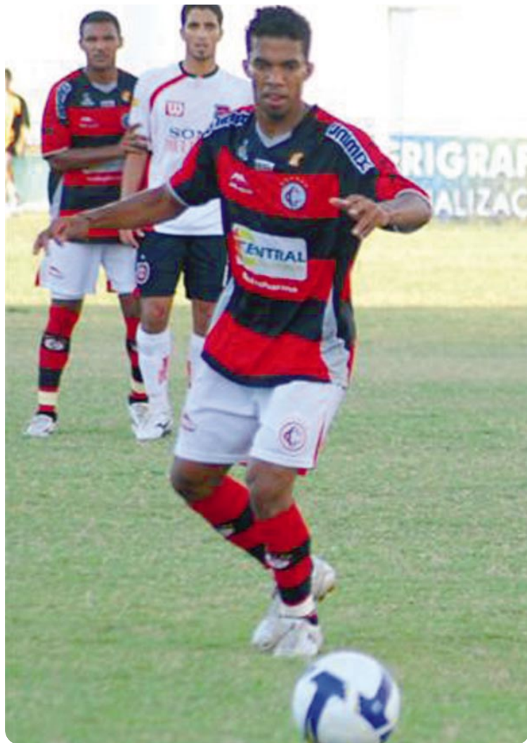
O atacante fez sucesso jogando pelo Campinense na Série C de 2008