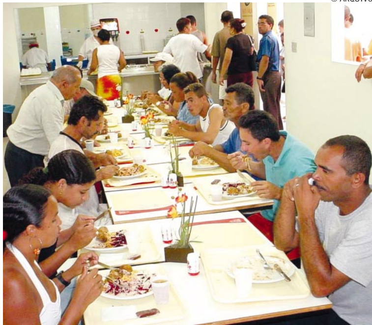
Nos restaurantes populares será oferecida refeição de excelente qualidade

Em João Pessoa, o Governo do Estado está implantando o sistema de esgotamento sanitário do Bessa. "Nós estaremos inaugurando, dentro de poucos dias, o sistema de