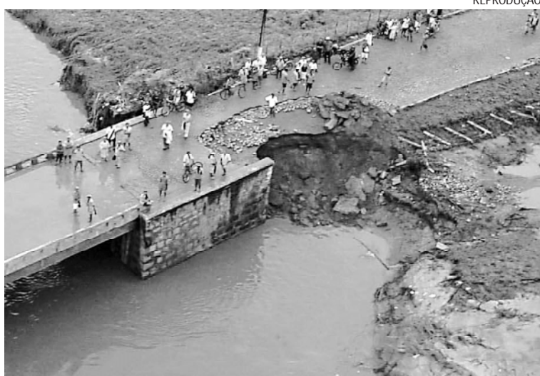
As chuvas causaram destruição e prejuízo em municípios paraibanos

A Paraíba teve níveis atípicos de precipitação, com uma média de 280 ml, contra uma média em torno de 150 ml. Na época, das 123 barragens existentes no Estado, 82 sangraram e atualmente, apenas 32 continuam vertendo águas. Ao todo, 49 municípios foram atingidos. Foram afetadas 13.195 pessoas. As fortes chuvas registradas em abril passado deixaram 288 casas destruídas, 1.370 moradias danificadas, 68 açudes ar-