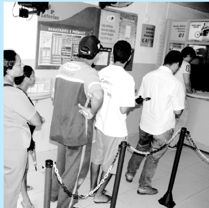
Apostadores vão se deparar com aumento da aposta a partir de setembro

Segundo informou a Assessoria de Comunicação da Superintendência da Caixa Econômica na Paraíba, o maior prêmio da Mega-Sena pago a um paraibano ocorreu no dia 25 de outubro de 2008, no Concurso 1016, quando um ganhador de João Pessoa recebeu mais de R$ 13,8 milhões. Além da Mega-Sena e da Lotofácil, a instituição ainda administra as seguintes loterias: Quina, que custa R$ 0,50 e ocorre nas terças, quintas e sábados; Timemania (R$ 2,00, aos sábados); Dupla Sena (R$ 1,00, nas terças e sextas); e Lotomania (R$ 1,00, nas quartas e sábados).