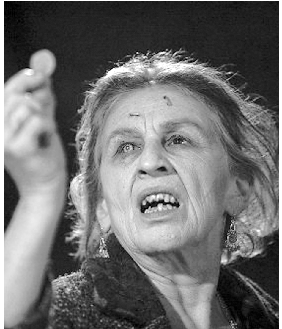
O filme de terror 'Arrasta-me para o Inferno' permanece em cartaz em dois cinemas de JP